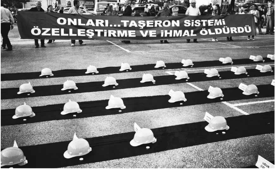
Facia sonrası Soma'da bir eylem, 2014.